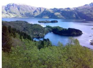
oversiktsbilde tomteområdet (venstre)