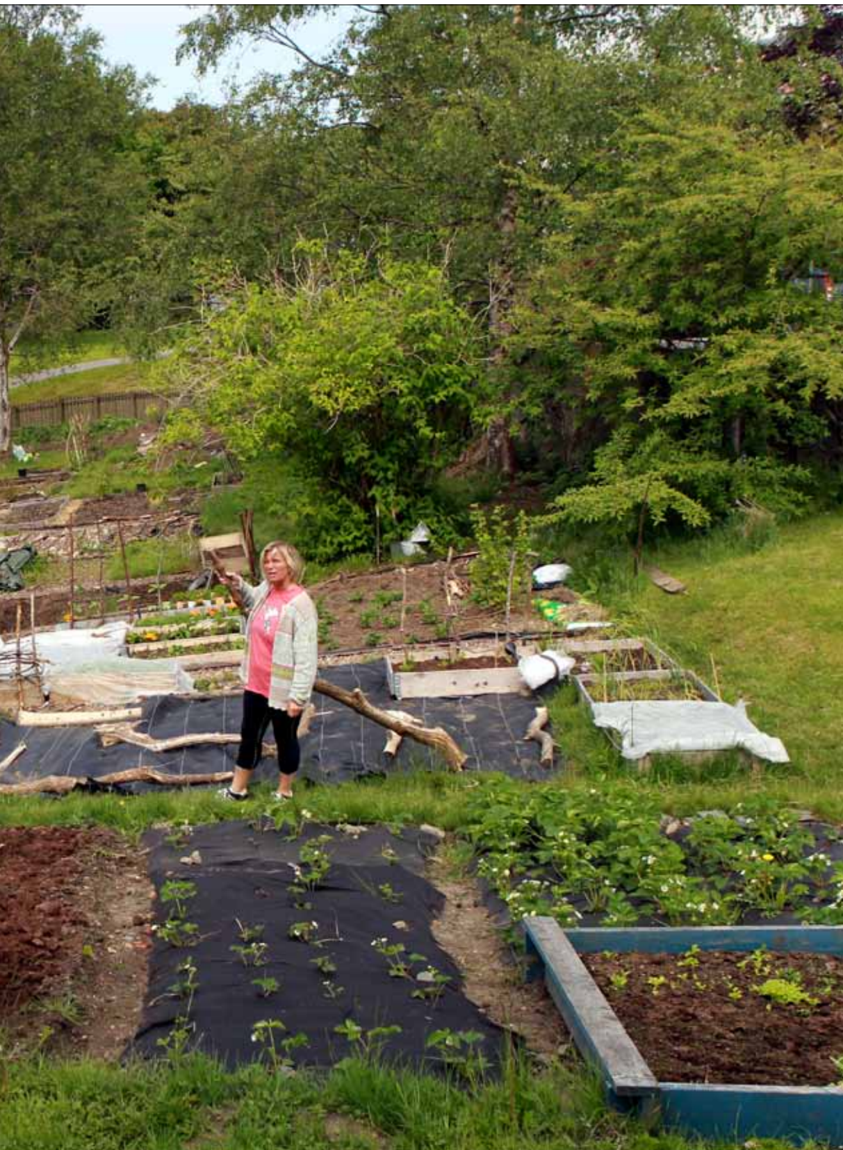
nok, sier hun.

Tips oss om smått og stort som skjer i byen. Send en e-post til byen@bt.no