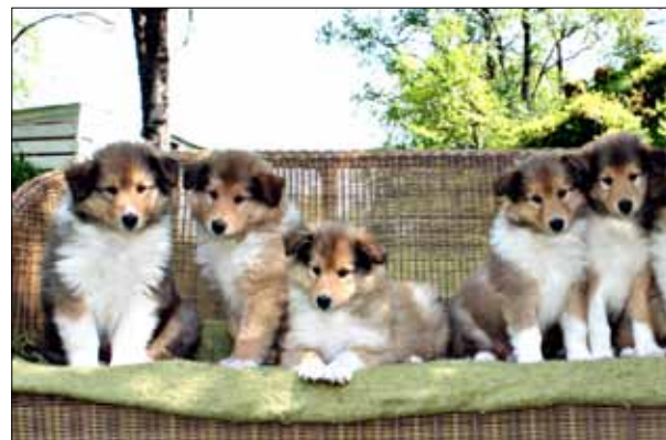
SOMMERGLEDE: Deilige dager skal nytes ute, på en passende hagebenk.

Send dine blinkskudd til leserbilder@bt.no eller som mobilfoto til 2211. Hver måned kårer vi en vinner som får flaxlodd i posten.