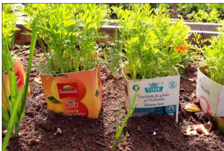
MAN TAGER .... Det er ikke nødvendig med fancy potter og annet utstyr for å utfolde seg i hagen.