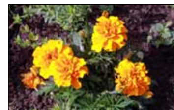
TAGETES: Vakre blomster, som i tillegg er effektive mot skadedyr.

frø og grønnsaksplanter her. Å plante i stedet for å så, kan være en grei måte å komme i gang på. Ellers er det viktig å dyrke noe du vet du liker. Reddik og spinat vokser fort, rødbeter kan du høste raskt, og ruccola er enkel å få til og har masse smak, tipser Bøckmann.